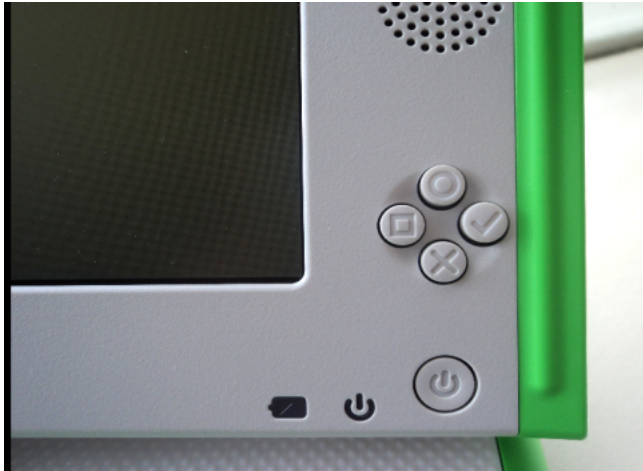
Figura 1: Los 4 «botones de juego»

«Release keys to continue» que significa «Suelte los botones para continuar».